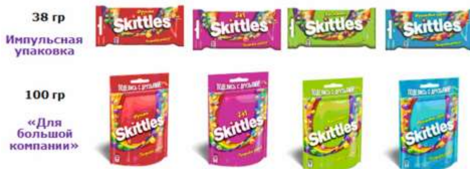
Рис. 2. Портфель жевательных конфет Skittles в России

У бренда Skittles есть свои отличительные характеристики: Целевая аудитория – подростки и молодые люди 14–25 лет.